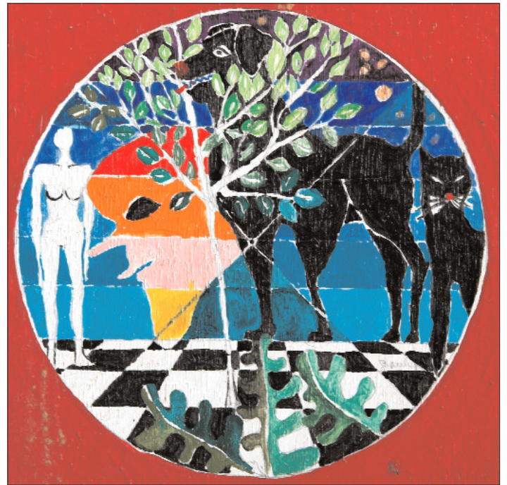
Bemalet træplade. 20 x 20 cm

Og rummet indtager Baukje Zijlstra bogstaveligt talt med sine tredimensionelle fjer-skulpturer eller eksempelvis skulpturen skabt af 9 løse æsker. Hun bevæger sig mellem sort/hvide grafiske arbejder og symmetriske papirklip og følsomme tuschtegninger, der i stor grad er indbegrebet af flade, til de reliefagtige værker og videre til skulpturen. Igen underbygger dette Baukje Zijlstra som en særdeles man-